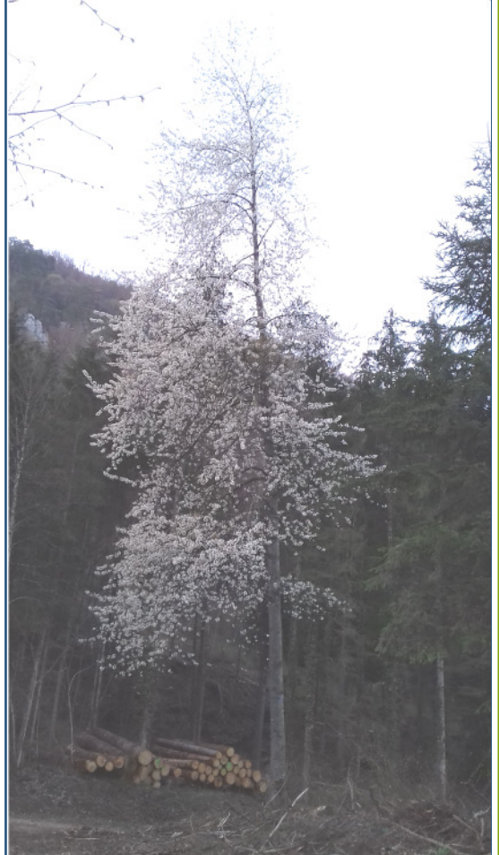
Foto: Toni Spaar / 15. April 2019 Wer weiss wo der Kirschbaum seht ?

Beinahe oder noch schöner als die Kathedrale „notre Dame zu Paris“