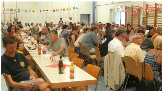
Bärschwiler Bundesfeier - ein volkstümlicher Anlass