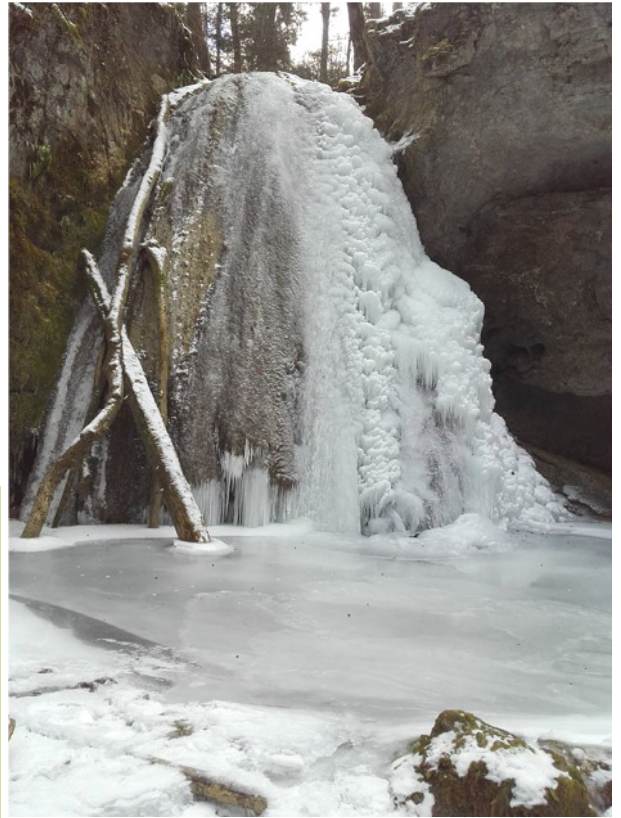
Wasserfall Stritterenbach im Januar 2017