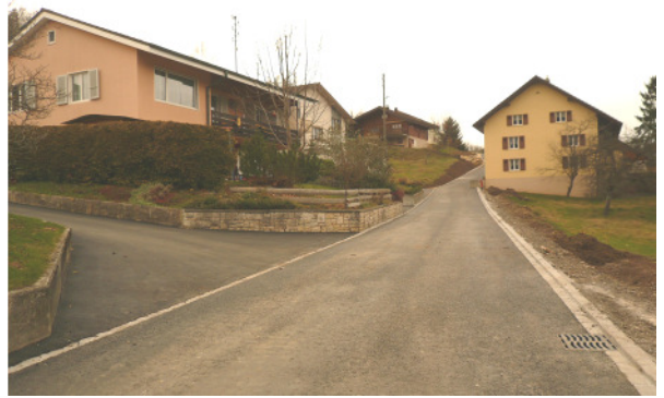
Projektstand: Ausbau Fahrenbodenstrasse